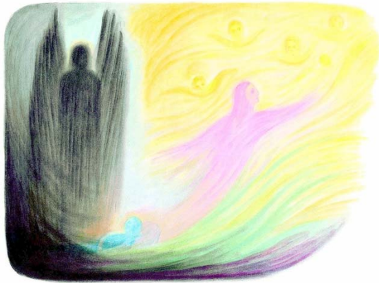
Todeserlebnis TI 08 1959 (86 x 62 cm) siehe auch Ein Totenbuch

Schwer war der Weg im Zeitenstrom zum dunklen Todestor. Schwer löste sich die Seele aus dem Erdenleib Und finstre Furcht verengte sie. Aber der Friede breitete sich Und nahm sie schützend in seine Schwingen. Da leuchtete das Licht der Geisteswelt auf, Und Freundesseelen empfingen mich. Ernst steht der lichte Hüter, Und die Seele hat Vertrauen zum Kommenden.