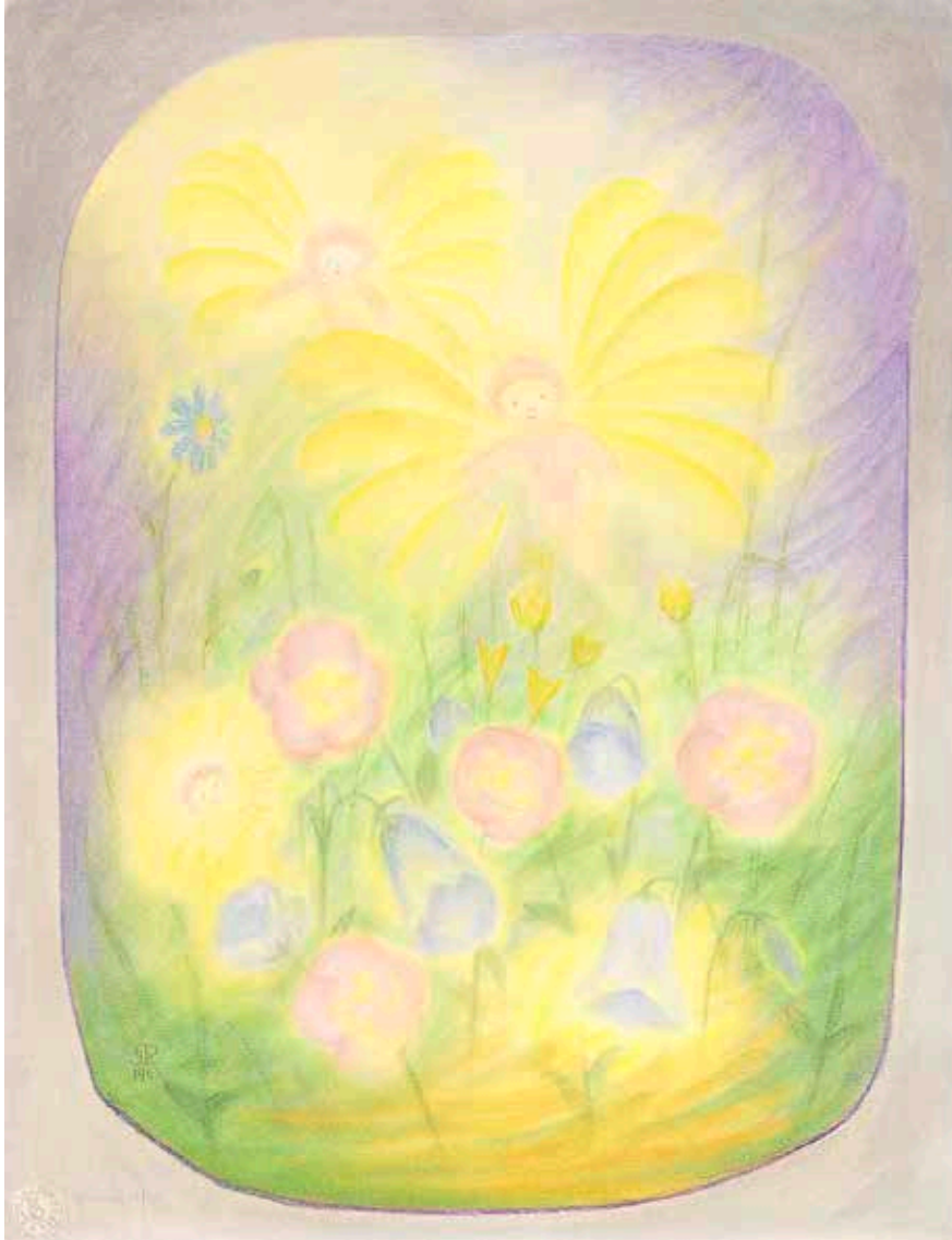
Blumenelfen 1968 (65 x 50 cm) NE 26

Mineralpigment auf Papier © Gerhard Reisch Stiftung - www.gerhardreisch.com