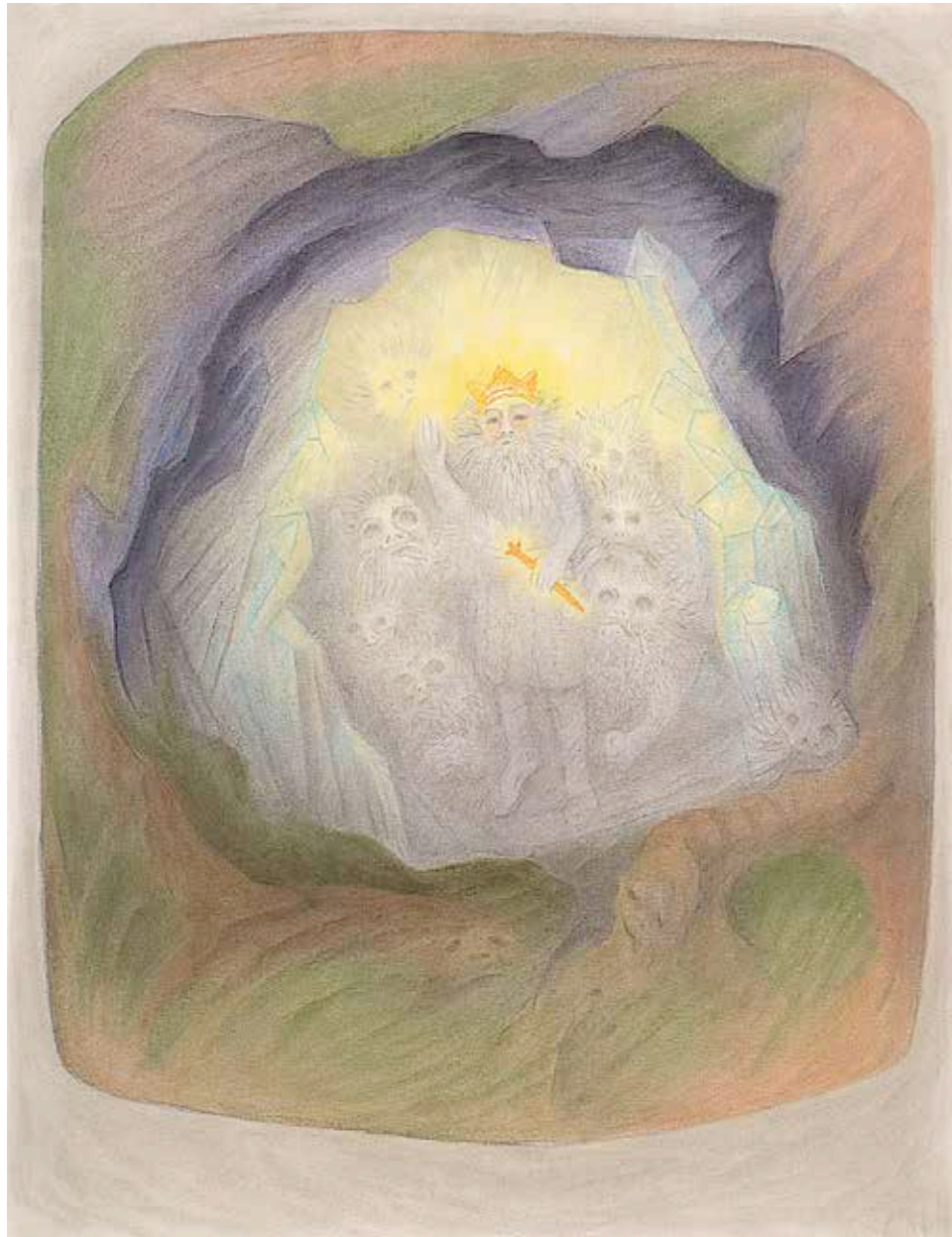
König Laurin [kein Datum] (73 x 68 cm) NE 06

Mineralpigment auf Papier © Gerhard Reisch Stiftung - www.gerhardreisch.com