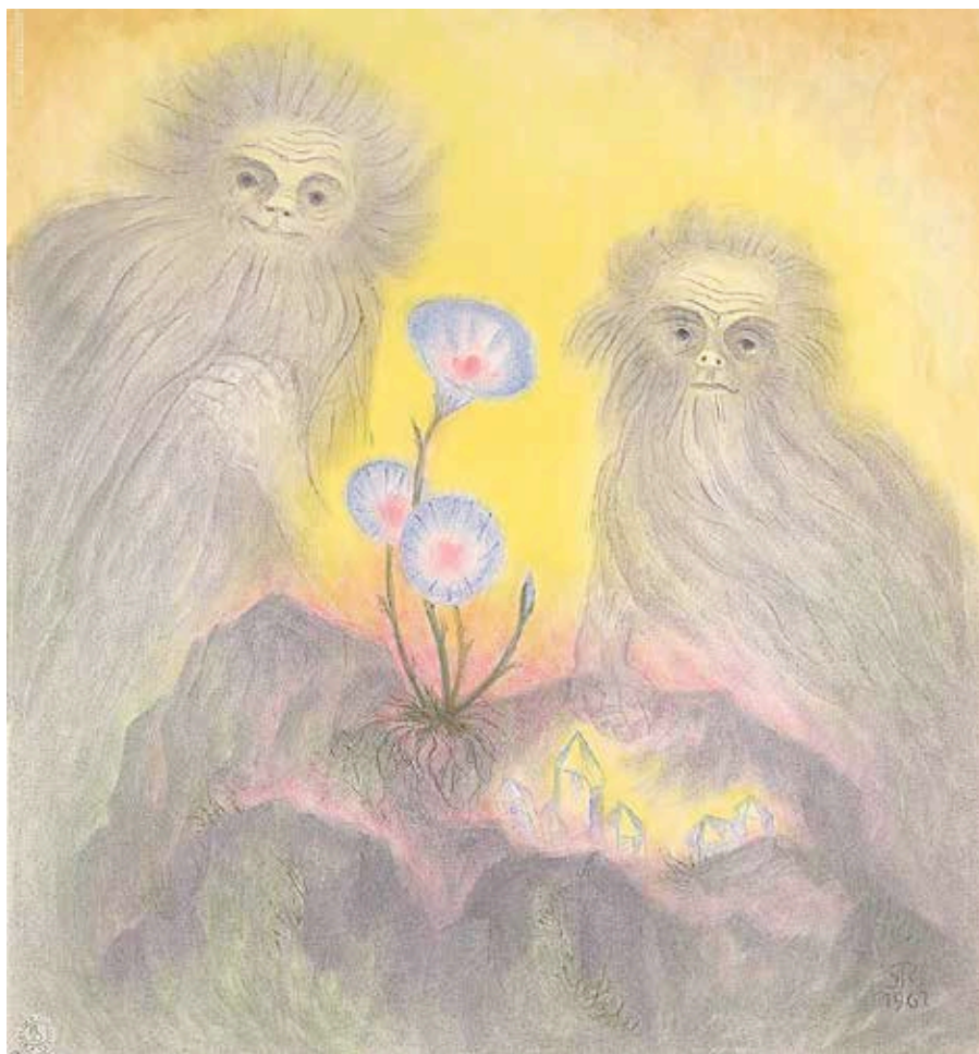
Zwei Gnomen mit blauer Blume 1967 (73 x 68 cm) NE 03

Mineralpigment auf Papier