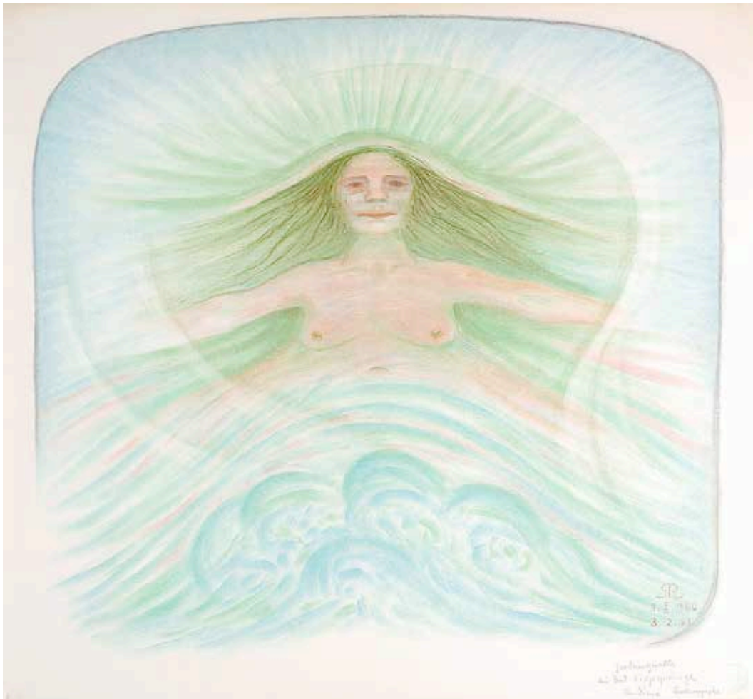
Nympe an der Jordanquelle bei Bad Lippspringe 1961 (68 x 73 cm) NE 12

Mineralpigment auf Papier © Gerhard Reisch Stiftung - www.gerhardreisch.com