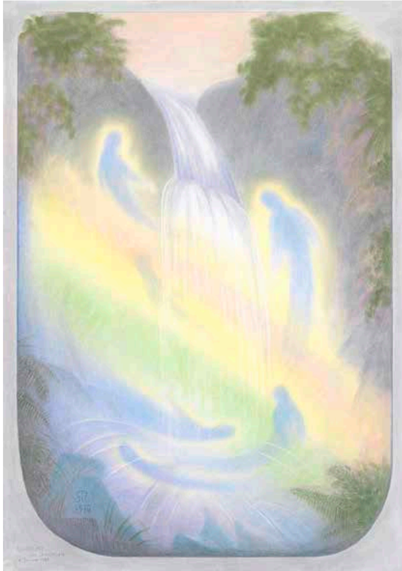
Undinen am Wasserfall 1970 (86 x 62 cm) NE 18

Mineralpigment auf Papier