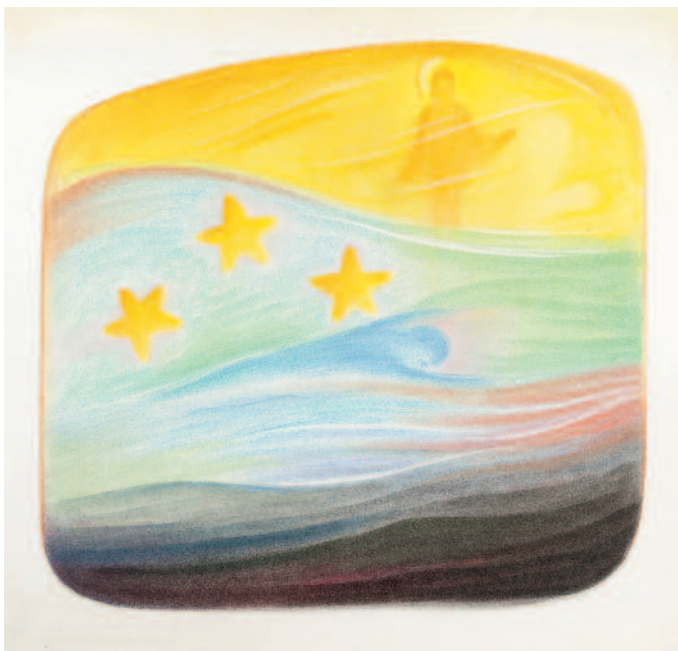
Totenseele im Traumschlaf 1959 (68 x 73 cm) TI 23

Im Schlafesdämmer lebst du dumpf dahin Und kaum ein Licht Scheint dir in diese Finsternis!